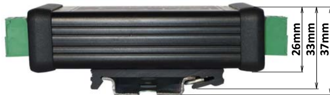
Pohľad z boku s pripevnenou DIN lištou